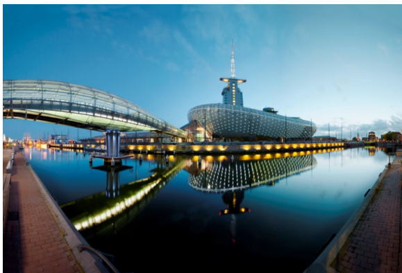
Außenansicht Klimahaus Bremerhaven 8° Ost.

Seit seiner Eröffnung im Juni 2009 hat sich das Klimahaus Bremerhaven zu einer der facettenreichsten und erfolgreichsten Themenattraktionen des Landes entwickelt. Erst im September erhielt die Erlebniswelt das Siegel der besten Tagungslocation Deutschlands. Symposien zu Klima-gerechtigkeit und Fachkongresse zur Nachhaltigkeit in der Aquaristik zählen hier ebenso zum Repertoire wie klassische Firmenfeiern.