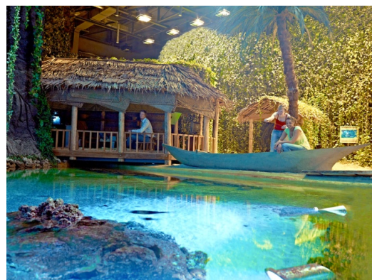
Reisestation Samoa .

Klimahaus® Betriebsgesellschaft mbH Am Längengrad 8 27568 Bremerhaven